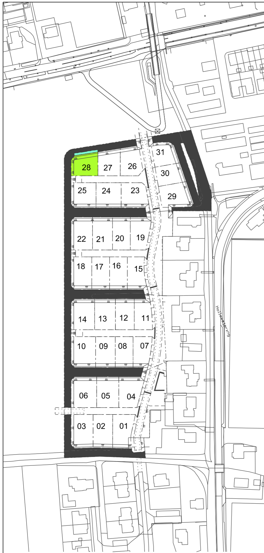
Situatie Schaal 1:2000